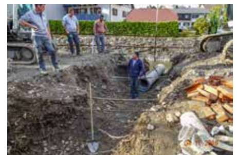
Die neue Ausleitung des Galetschabachs in die Meng.