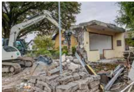
Am Standort der alten Milchsammelstelle wurde Platz für eine neue, videoüberwachte Wertstoffsammelstelle geschaffen.