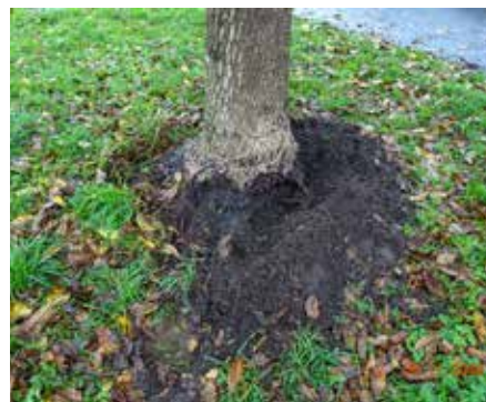
In eine Richtung fehlen die Wurzeln vollständig.