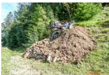
Dieser Materialberg musste aus dem Ofen herausgeschaufelt werden.

Ein Team der Firma „Steinwerk Andelsbuch“ hat die Arbeiten durchgeführt.