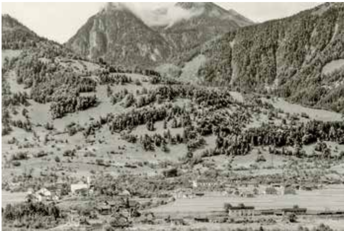
Ansicht von Nenzing in den 50er-Jahren.