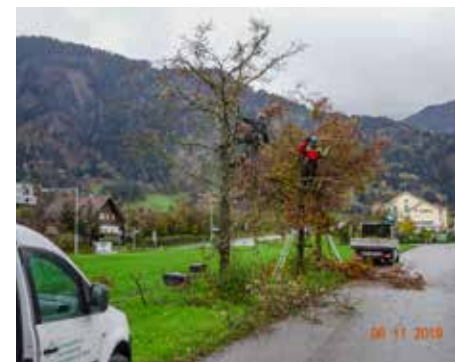
Kleine Bäume werden am besten von oben geschnitten.