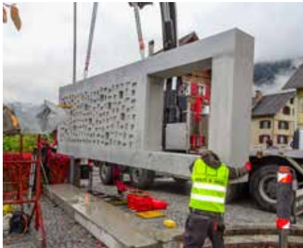
Ein Autokran hebt den ersten Teil der Gedenkwall des Gemeinschaftsgrabes auf das vorbereitete Fundament.

auch wenn die Angehörigen keine Möglichkeit haben, die Grabpflege selbst zu übernehmen. Die Pflege übernimmt die Gemeinde. Im Gemeinschaftsgrab sind nur Urnenbestattungen möglich.