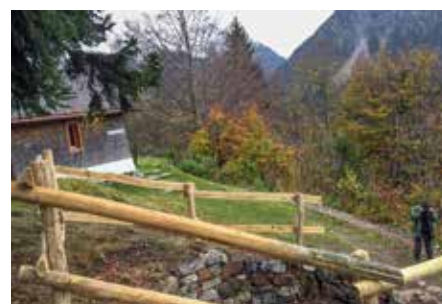
Mit der Umzäunung aus Robinienholz wurden die Arbeiten abgeschlossen.