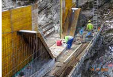
Einbau der Abflusssektion. Der Stahlpanzer soll den Betonabrieb verhindern.