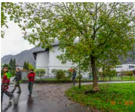
Wegen massiver Wurzelschäden musste ein Nussbaum im Wiesengrund gefällt werden. Es wird aber ein neuer gepflanzt.

tem Boden. Die Wurzeln sind den Verkehrsbelastungen ausgesetzt. Manch einer muss leider gefällt werden.