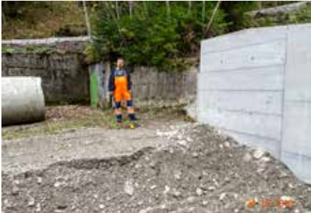
Im Hintergrund die Quelfassung. Die wichtigste Sperre liegt direkt daneben.

kann. Die Wildbach- und Lawinerverbauung leistet hier hervorragende Arbeit.