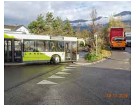
Der Bus „kratzt“ die Kurve. Manchmal streifen sie auf dem Gehsteig. Das soll sich auch ändern.