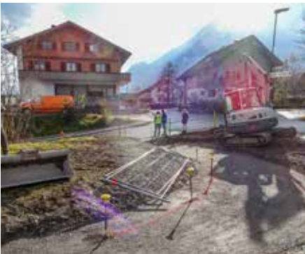
Die neue Gehwegeinmündung in die Bahnhofstraße.

Dass die umgegrabenen Flächen mit heimischen Blumen und Stauden bepflanzt werden, versteht sich inzwischen fast schon von selbst.