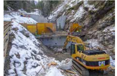
Im Vordergrund ist der Bau der dritten Sperre zu sehen.