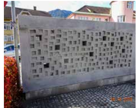
In die rechteckigen Nischen kommen die Gedenktafeln aus Messing. Es gibt drei unterschiedliche Größen