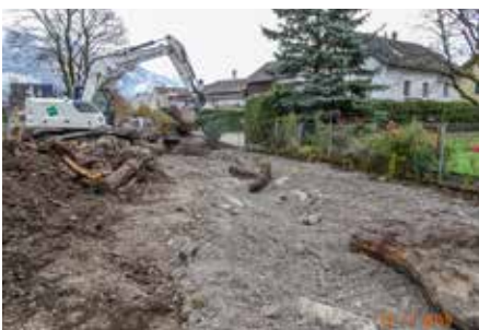
Das neue Bachgerinne wird herausgearbeitet und mit Waschschlamm aus den Steinbrüchen abgedichtet.