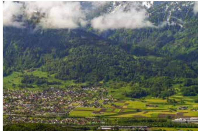
Zum Vergleich die Ansicht von Nenzing im Jahre 2012.