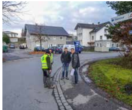
Dieser Gehsteigbereich wird abgetragen, der Kurvenradius für die Busse verbessert.