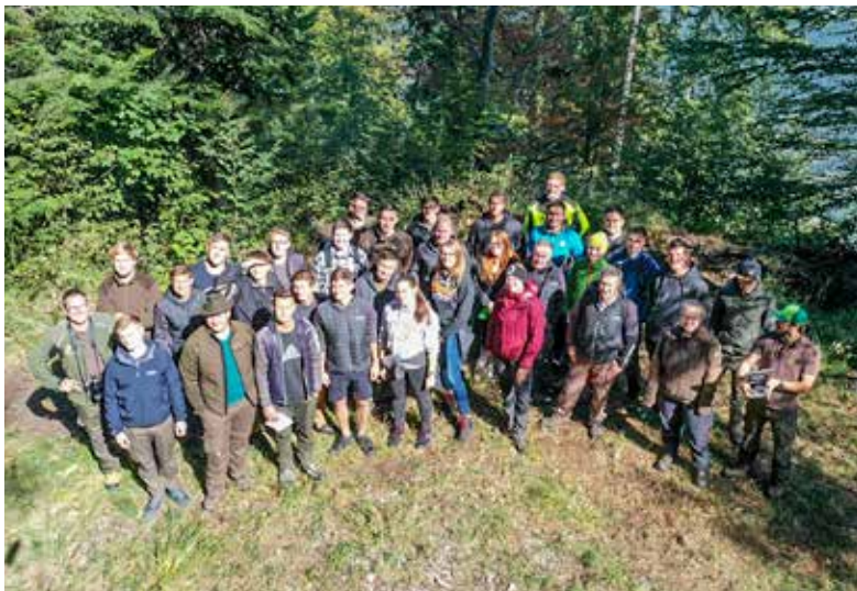
Abschlussklasse der Försterschule Bruck in Böschis - Drohneneinsatz in der Waldbauplanung

Abschließend wünschen wir Ihnen ruhige, besinnliche Weihnachten unter einem Nenzinger Christbaum und ein gesundes, glückliches neues Jahr.