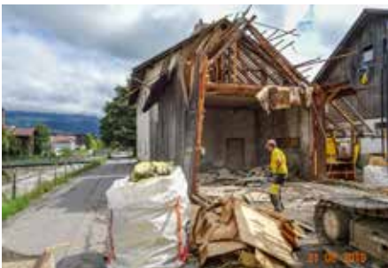
Der Abriss des alten Feuerwehrhauses schafft Platz für einen Gehsteig.

zu durchwandern. Die mengenkontrollierte Einleitung des Galetschabachs sorgt für eine abwechslungsreiche Ausgestaltung.