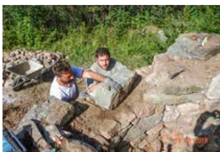
Für die Rekonstruktion der fehlenden Mauer-teile wurden die herumliegenden Steine verwendet.