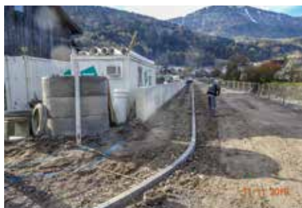
Hier stand das alte Feuerwehrhaus. Jetzt ist Platz für einen Gehsteig.