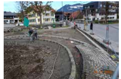
Neue Einbinderadien erleichtern die Einfahrt in die neu sanierte Straße.