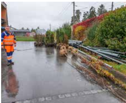
Die angelieferten Sträucher wurden im Bauhof zwischengelagert.

hofmitarbeiter wurde hier eine neue Hecke angelegt. Ein weiterer Beitrag zur Naturvielfalt in der Gemeinde.