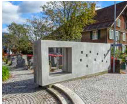
Diese Seite ist der Straße zugewandt. Deutlich erkennbar: die quadratischen Lichtöffnungen.