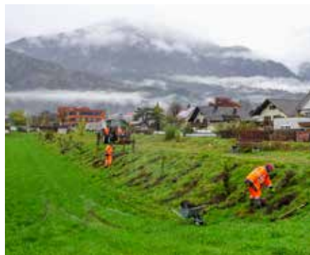
Die Sträucher und Bäume werden in die von einem kleinen Bagger hergestellten Pflanzlöcher gesetzt.